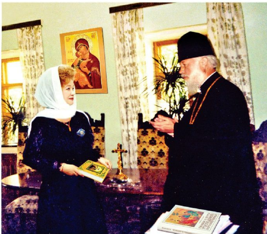
Фотография в день вручения Блаженнейшим Митрополитом Киевским и всея Украины, Предстоятелем Украинской Православной Церкви Владимиром автору ордена «Рождество Христово»

Духовных книг я много написала, И душа снова к Господу ведёт, Писать поэмы о Святых возвала, И к вам на суд Всевышний их даёт.